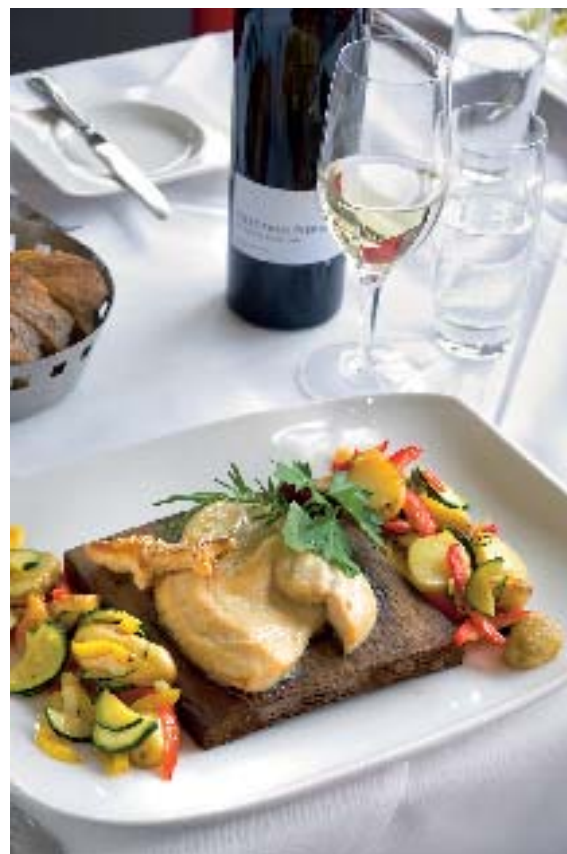
Das Restaurant Park am Rheinfall serviert Saibling auf Zederholz mit Sommergemüse und passendem Sauvignon blanc Sélection Pierre.