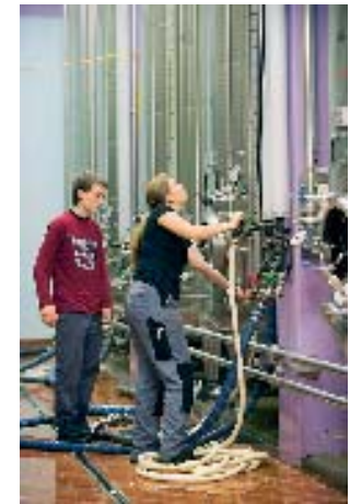
Kellerarbeit in der Weinkellerei Rahm.