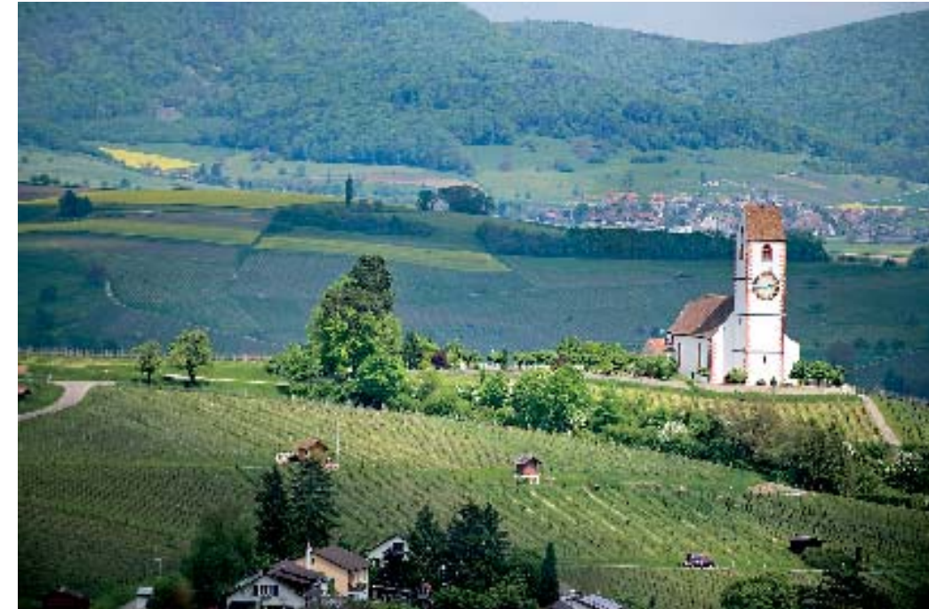
Die Weinfelder und Bergkirche von Hallau. Das historische Weindorf gehört zum lieblich «Schaffhauser Blauburgunderland», an drei von vier Rebstöcken wachsen Trauben dieser Sorte.